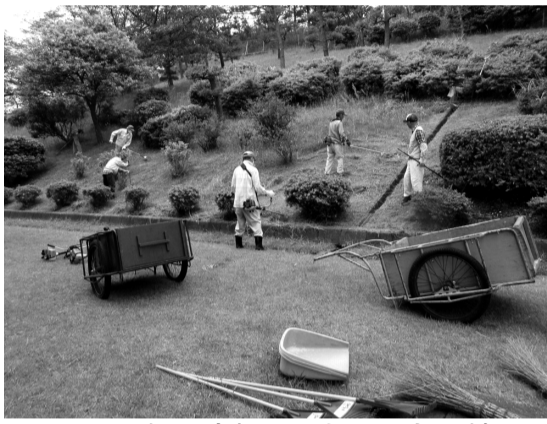
コロナ禍で大幅に遅れていた団地の芝生など植栽剪定作業を急ぐ住民＝横浜市金沢区の六浦台住宅で

緊急事態宣言が解除された2日目の27日、街の様子を探りに出た。横浜市青葉区のある団地住民は、電車が少し込み合ってきたようだが、スーパーなどの人出はあまり変わりがなく、と感じたという。27日から開館された市の図書館に向いたが、なんと制限開館で、事前に予約した本の受け取りと返却ポストだけの受け付けだった。4月11日以来、休館が続いて、調べものに不自由していただけに落胆した表情だった。