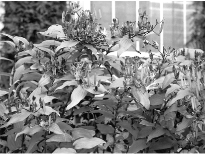
ホトトギス (杜鵑草) コリ科

秋が深まる頃に開花し、白い斑点がついていて、鳥の腹の模様を思わせる。高さは1m程度で、東アジアに分布している。